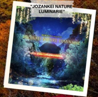
"JOZANKEI NATURE LUMINARIE"

วันเดินทาง 23 - 28 ต.ค. 2569 (วันปืยมหาราช) 28 ต.ค. - 2 พ.ย. 2569 30 ต.ค. - 4 พ.ย. 2569