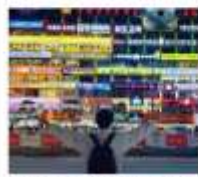
กำแพงมหาวิทยาลัยเหอชิ่งเป็น