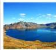
ฉางไป่ซาน