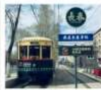
มังกรธาอู๋ดางซุน