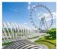
สวนสาธารณะ OH BAY