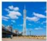
จัตุรัสอ่าวเจิ้ง