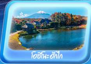
โอชิโนะอ๊กโก