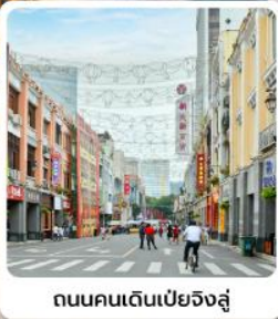
ถนนคนเดินเป่ยจิงสู๋