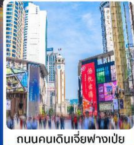
ถนนคนเดินเจี่ยฟางเปย