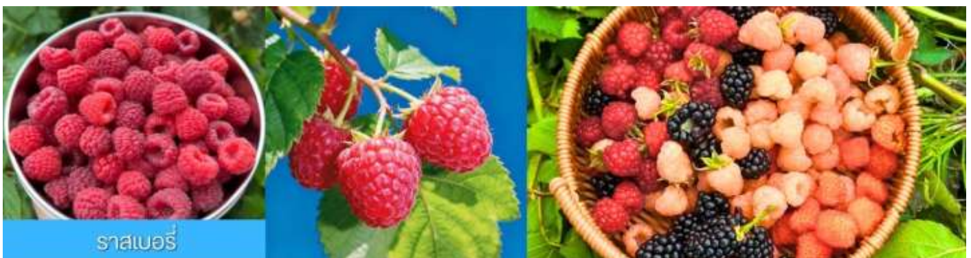
ราสเบอร์รี่