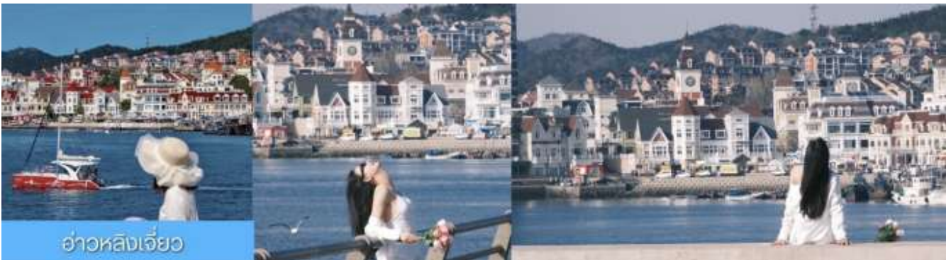
อ่าวหลิงเจี้ยว

จากนั้นนำท่านเที่ยวชม ท่าเรือประมงหู่กาน 大连渔人码头 เป็นจุดเช็คอินที่โดดเด่นด้วยสถาปัตยกรรมสไตล์ยุโรปสีสันสดใส ผสมผสานกลิ่นอายเมืองท่าดั้งเดิมเข้ากับบรรยากาศสุดโรแมนติกที่เต็มไปด้วยเรือประมง คาเฟ่ ร้านอาหาร และจุดชมวิวยุริมาทะเล