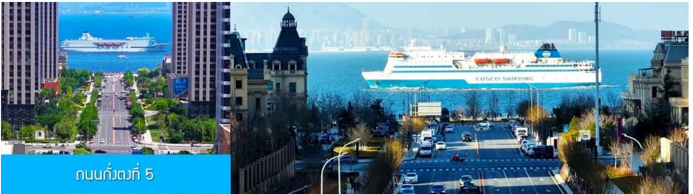
ถนนกั๋วตงที่ 5

หลังอาหารนำท่านเที่ยวชม ถนนกั๋วตงที่ 5 港东五街 จุดเช็คอินใหม่ที่ได้ได้รับความนิยมอย่างสูงจากนักท่องเที่ยวและชาวเมืองต้าเหลียน จุดนี้เป็นช่วงที่ถนนสายกั๋วตงที่ห้า มุ่งตรงสู่ทะเล(มองจากจุดชมวิวที่อยู่ด้านบน) เสมือนว่าปลายทางของถนนไปสิ้นสุดในทะเล อีกด้านจะมองเห็นท่าเรือและอาคารสถาปัตยกรรมตะวันตกเป็นกรอบของมุมมองที่งดงาม เมื่อมีเรือแล่นมาผ่านทะเลตรงบริเวณนี้ จะเป็นภาพที่สวยงามและโรแมนติก