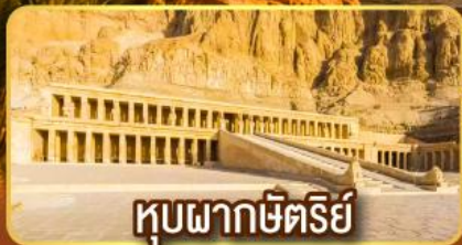
หุบผากษัตริย์