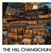
THE HILL CHANGCHUN