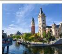
เมืองเวนิสแห่งต้าเหลียน