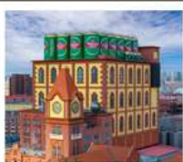
โรงเบียร์สิงคโปร์