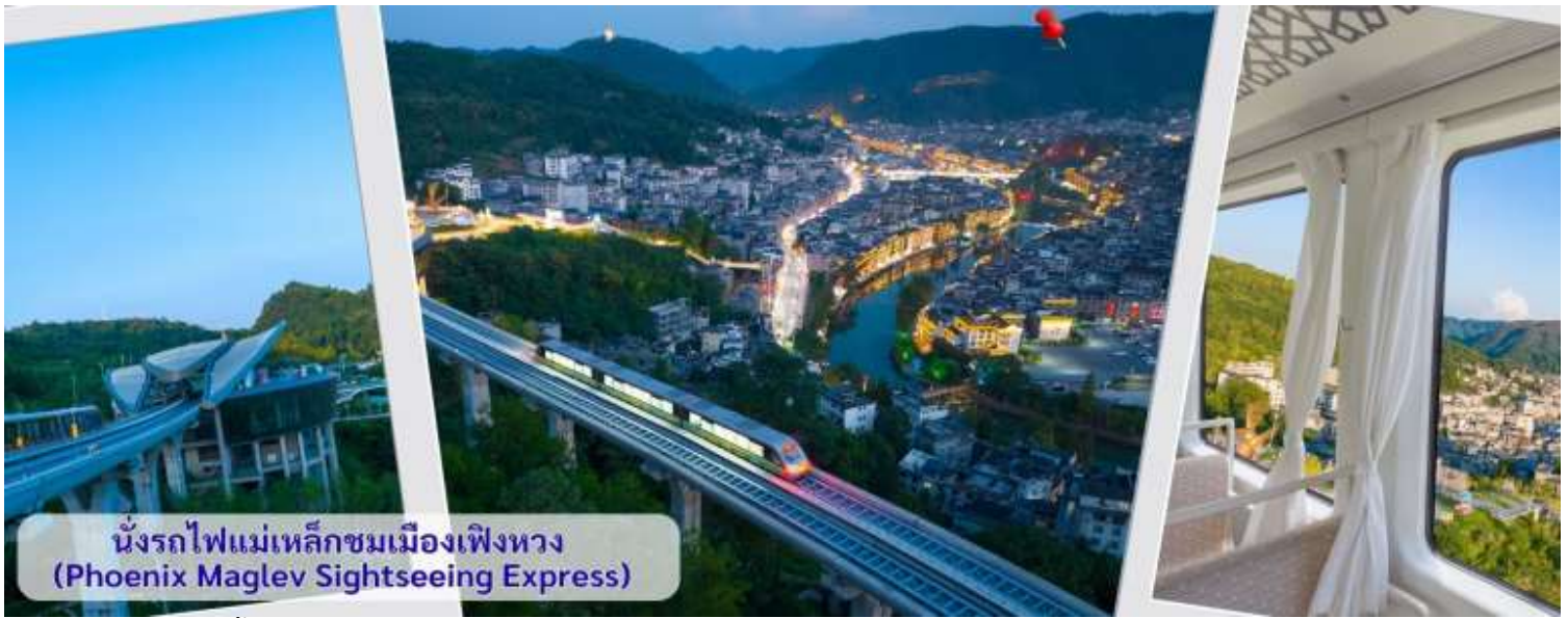
นั่งรถไฟแม่เหล็กชมเมืองเฟิงหวง (Phoenix Maglev Sightseeing Express)

จากนั้นนำทุกท่าน เดินถนนโบราณ Feng Hueng Ancient Town ที่ถนนช้อปปิ้ง Shibanshi Street เมืองที่ยังคงรักษาเอกลักษณ์ความเป็นพื้นเมืองผสมผสานกับยุคปัจจุบันเอาไว้ได้อย่างลงตัววิถีชีวิตของชาวบ้านที่อาศัยอยู่ที่นี้ บรรยากาศในเมืองเฟิงหวง ถนนเก่าช้อปปิ้งเป็นถนนปูหินแคบๆ กว้างไม่ถึง 5 เมตร ทอดยาวจากทางเข้าวัดเต้าเหมินไปทางทิศตะวันตก ผ่านถนนหลายสาย ได้แก่ ถนนครอส ถนนเจิ้งตะวันออก ถนนเจิ้งตะวันตก ศาลาสูยหลง หียงเซียวซง เต้าซ่านลา ศาลาเจียกั๋ว และสุสานเงินฉงเหวิน สุดท้ายจะนำไปสู่ “น้ำพุแรกใต้ฟ้า” ถนนสายนี้มีความยาวกว่า 3,000 เมตร และเป็นย่านการค้าที่คึกคักที่สุดในเฟิงหวง