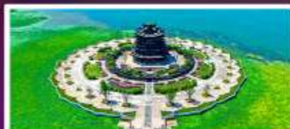
วิดองหวน