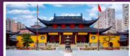
วิดพระหยกขาว