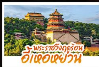
พระราชวังฤดูร้อน อู่เต๋อเฉยวัน