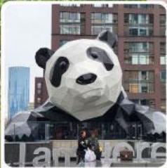
แพนด้าปิ่นตึก IFS