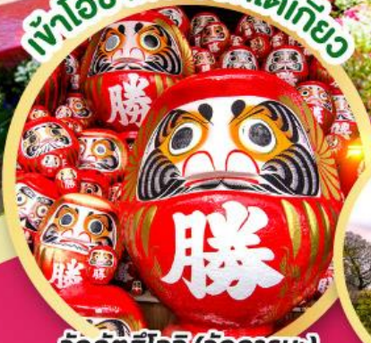
วัดคัตสึโอจิ (วัดดาร์จูมิ)