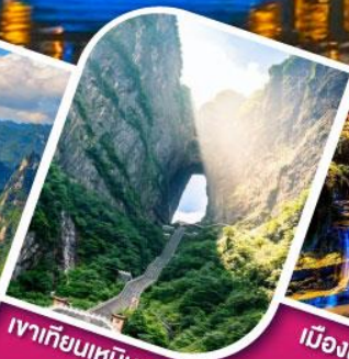
เฝ้าเทียนเหมินซาน