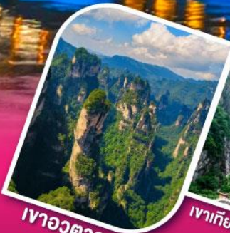
เฝ้าอวตาร