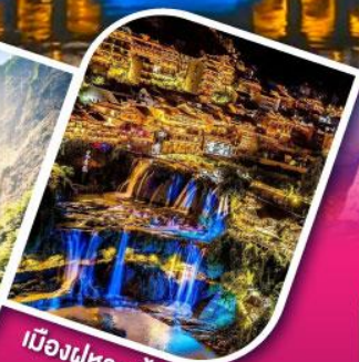
เมืองผู่หลงเจิ้น