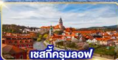
เซสท์ক্রุมลอฟ