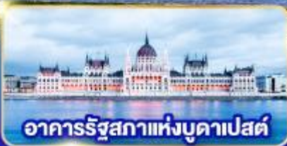
อาคารรัฐสภาแห่งบูดาเปสต์