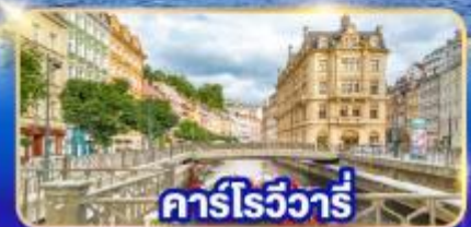
คาร์โรวัวร์