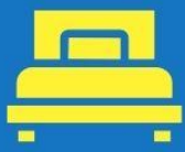
ห้องพักเดี่ยว SINGLE

ตัวอย่างประเภทห้องพัก *เป็นเพียงตัวอย่างเพื่อให้เห็นภาพสำหรับประเภทห้องในแบบต่างๆ