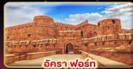
อัครา ฟอรั